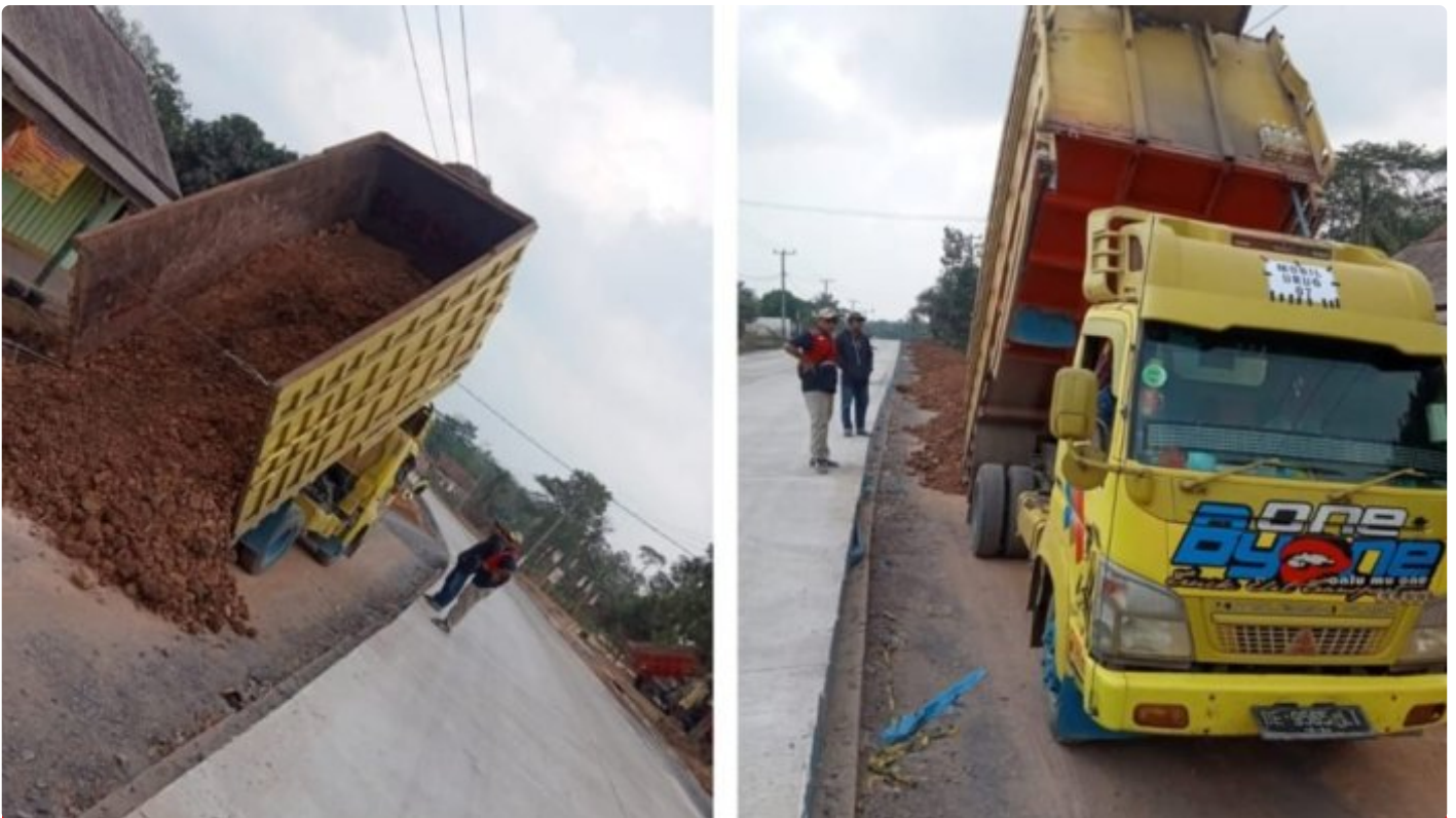
Mobil Pengangkut Tanah Galian C